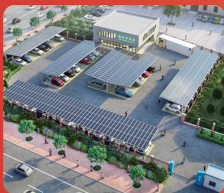
光储充一体化车棚