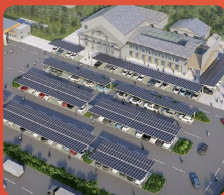
高速服务区停车场